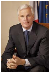
Michel Barnier, Ministre de l'agriculture et de la pêche

Augmenter la consommation des fruits et légumes est aujourd'hui une nécessité, compte tenu des enjeux nutritionnels et de santé. Il s'agit par ailleurs d'une des neuf recommandations du Plan National Nutrition Santé. C'est pourquoi nous avons engagé avec la filière plusieurs projets qui doivent contribuer à améliorer l'accessibilité aux fruits et légumes, notamment à travers la promotion de fruits et légumes de saison et de proximité.